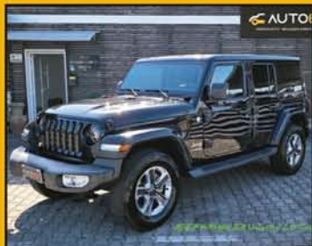
JEEP WRANGLER Unlimited 2.0 Turbo Sahara, anno 2019, full optional