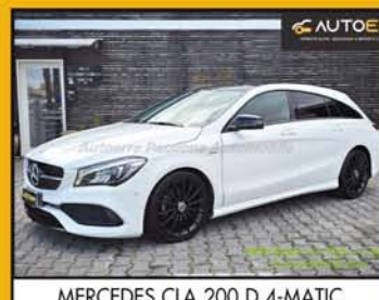
MERCEDES CLA 200 D 4-MATIC SHOOTING-BRAKE EDITION, anno 2019, full optional