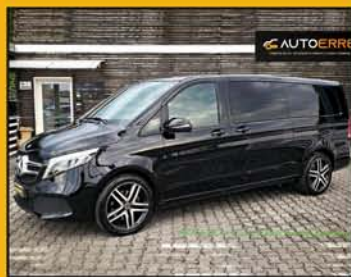
MERCEDES V 250 d 4Matic Premium Extralong, anno 2022, full optional