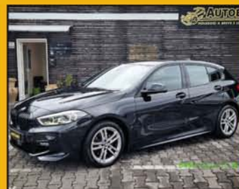
BMW 116 D 1.5 MSport anno 2021