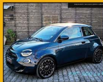
FIATe 500 La Prima anno 2022, full optional