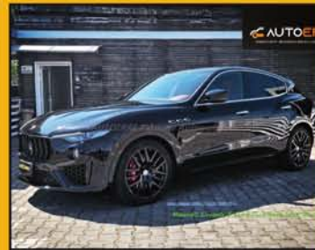
MASERATI LEVANTE 3.0 V6 TwinTurbo Gran Sport Q4, anno 2019, full optional