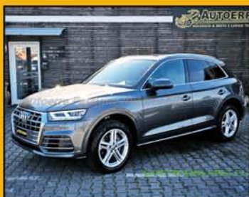
AUDI Q5 TDI QUATTRO S-Tronic S-Line anno 2020, full optional