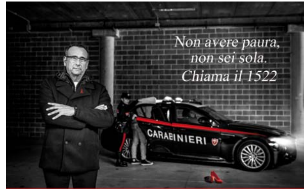
25 novembre - Giornata internazionale per l'eliminazione della violenza contro le donne.

un impegno collettivo, non solo di repressione, ma anche di prevenzione. Per questo motivo, i carabinieri si dedicano alla formazione continua del proprio personale , al fine di garantire che le vittime siano accolte con empatia e rispetto. All'interno delle caserme, grazie al supporto dell'associazione Soroptimist, sono state create stanze riservate, ambienti sicuri e protetti, fondamentali per permettere alle donne di formalizzare una denuncia in un contesto di tranquillità e riservatezza.