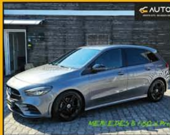
MERCEDES CLASSE B180 d Premium anno 2019, full optional