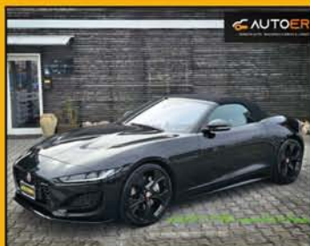
JAGUAR F-TYPE Convertible R-Dynamic anno 2022, full optional