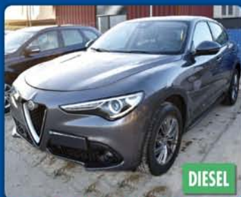
ALFA ROMEO STELVIO 2.2 190CV Q4, anno 2019, km 100.000