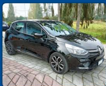
RENAULT 1.5D 4posti autocarro, anno 2019