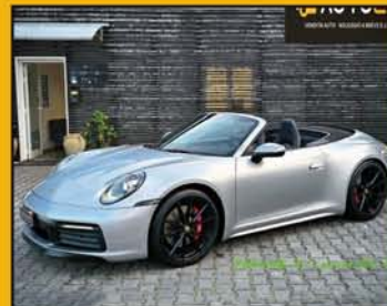
PORSCHE 911 Carrera 992 4S Cabrio anno 2020, full optional