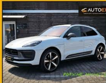
PORSCHE MACAN 2.0 T anno 2024, full optional