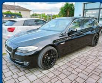
BMW 520D SW anno 2011, full optional

CIVITANOVA MARCHE - Via Del Casone, 18 - dietro EUROSPIN - 0733.1830371 - 348.3368984 - www.mbauto.it