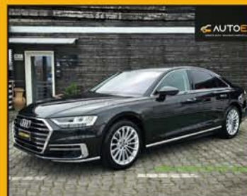
AUDI A8 50 TDI 3.0 Quattro Tiptronic anno 2020, full optional