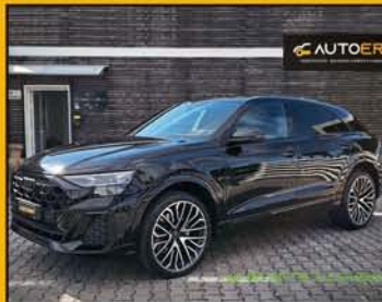
AUDI Q8 50 Tdi S-Line Quattro anno 07/2024, full optional