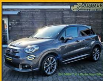
FIAT 500X T4 S-Design 150 cv Sport anno 11/2019, full optional