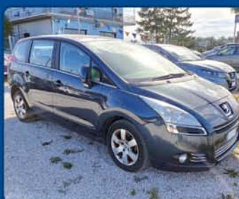
PEUGEOT 5008 1.6 HDi automatica anno 2012, km 130.000