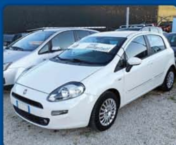
FIAT PUNTO 1.3 multijet anno 2013, km 115.000