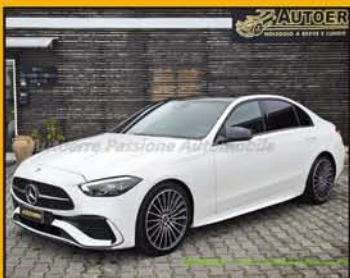
MERCEDES C 300 d Mild Hybrid Premium Plus AMG, anno 12/2021, full optional