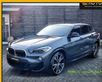
BMW X2 xDrive 18d MSport anno 2019, full optional