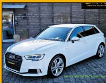
AUDI A3 SPORTBACK 30 TDI S-Tronic Sport S-LINE, anno 2019