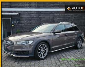
AUDI A6 Allroad 3.0 TDi anno 07/2018, full optional