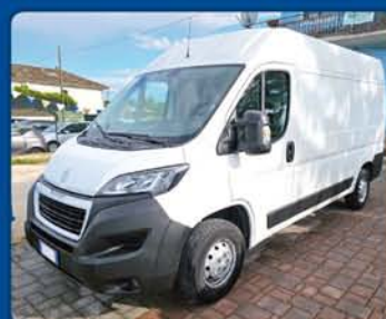
PEUGEOT BOXER 2.2 HDi anno 2020, km 110.000