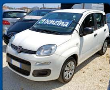
FIAT PANDA 1.2 benzina anno 2019, km 65.000