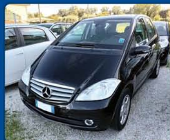
MERCEDES CLASSE A 160D anno 2011, km 125.000