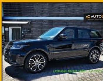
RANGE ROVER Sport 3.0 TDV6 HSE Dynamic, anno 04/2018, full optional