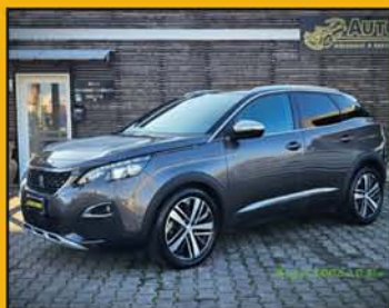
PEUGEOT 3008 2.0 Blue-HDi GT anno 2019, full optional