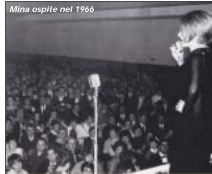
Mina ospite nel 1966