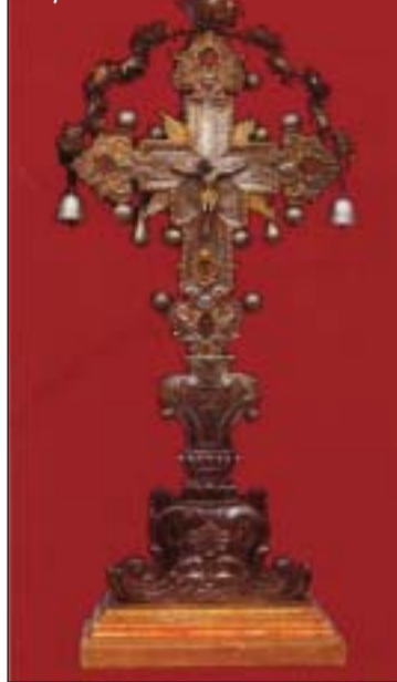
Reliquario della Santa Croce

Uscendo dal paese si è colpiti da una sorta di parco naturalistico che sorge su di un cocuzzolo: è la cosiddetta "torricella", piccola costruzione a torre, appunto, circondata da pini e querce. Belmonte quindi come sinonimo di "natura", oltre che di storia millenaria e di arte; in tal senso nelle verdeggianti campagne e tra i boschi sono stati realizzati comodi sentieri segnalati, ideali per lunghe passeggiate o escursioni in bicicletta.