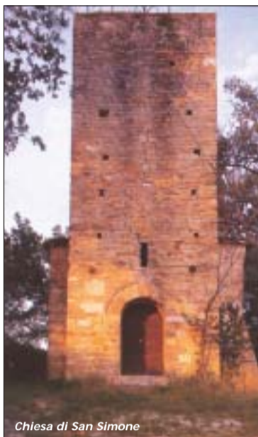
Chiesa di San Simone

L'1, il 2 e il 3 maggio si svolgono a Belmonte Piceno i festeggiamenti in onore della Santa Croce di cui viene conservato un frammento in uno splendido reliquario cesellato del secolo XIII in lamina dorata, arricchito dal contorno in argento dei secoli XV e XVII. La Santa Croce, simbolo della Passione di Gesù, è onorata a Belmonte da secoli in occasione della benedizione della campagna,