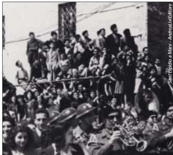
San'Elpidio a Mare - Andrea Livi Editore

Il 25 aprile dunque come giorno della ripresa e dell'avvio della rinascita nazionale, della valorizzazione di un progetto che portò in tempi brevi alla riunificazione del territorio nazionale ed alla ricostituzione della Nazione ma, soprattutto, ad una ampia collabo-