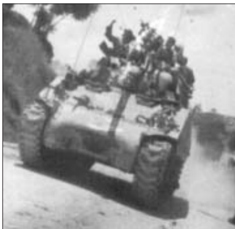
Nella foto: primo carroarmato entrato a Civitanova Alta - giugno 1944