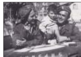
Polacchi a Fermo