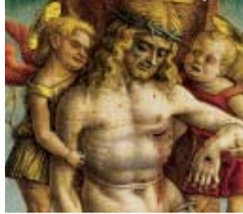
Carlo Crivelli a Montalto Marche (part.)

"In giro per musei", in una zona dove ogni chiesa può comodamente dirsi piccolo "museo", potrebbe essere un altro di quegli itinerari da costruire e da offrire. Che la proposta "tiri" ce lo ha detto il ponte di Pasqua. Che tiri anche il territorio nel suo complesso è un altro dato da verificare perché le condizioni ci sono, e bisogna sfruttarle.