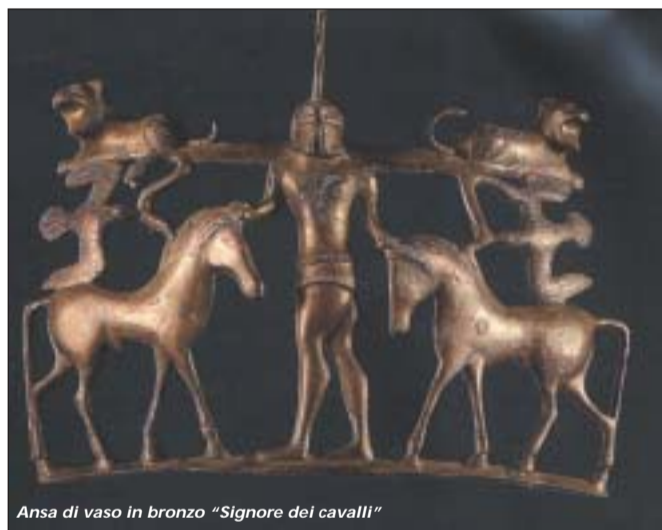
Ansa di vaso in bronzo "Signore dei cavalli"

Nei week end fino a Pasqua 2005, all'interno del teatro comunale, mediante computer predisposti per l'occasione e guidati da personale qualificato, è possibile infatti visionare un CD (che può anche essere acquistato), chiaro ed esaustivo sull'argomento e che illustra inoltre con immagini di ottima qualità, la mostra recentemente ospitata. Gli stessi operatori accompagneranno i visitatori nei luoghi più inte-